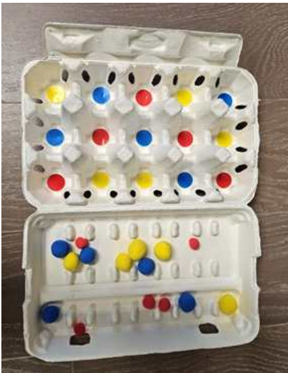
그림 2) 이용인 선호물 사진/그림(3~4개) 출력본